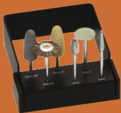
Kit de ajuste y finalización

Una amplia gama de productos para su comodidad y la del paciente