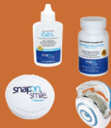
Accesorios para los pacientes